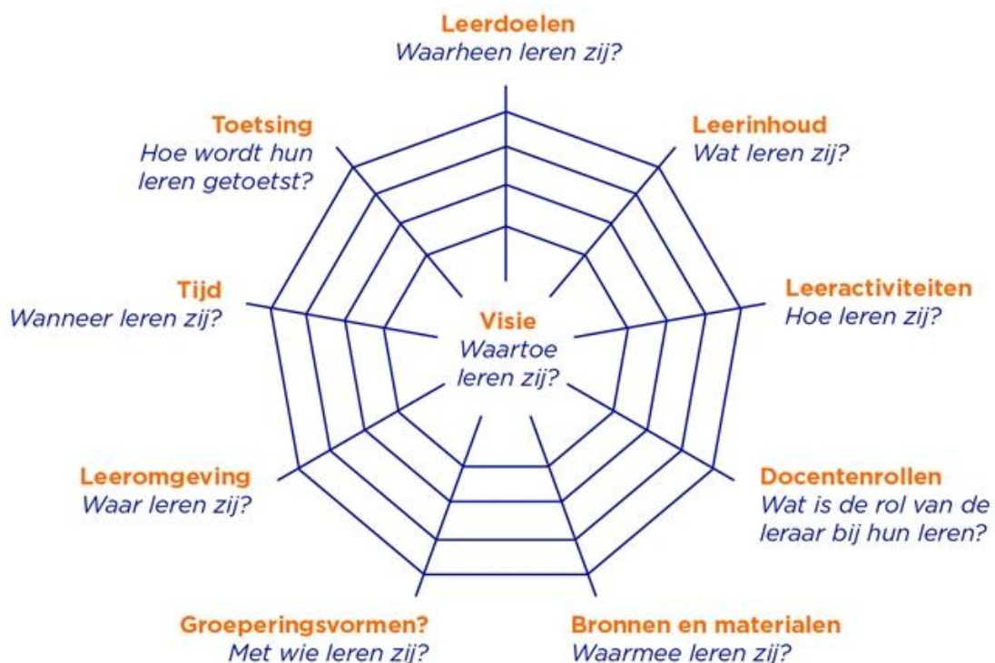
Figuur 1: Spinnenwebmodel van Van den Akker, 2003

In de missie van de Oranjeschool staat het concept ‘succesvol leren’ centraal. Hiermee bedoelen wij dat leerlingen zich optimaal ontwikkelen op basis van een samenhangend en doelgericht onderwijsaanbod. Om dit vorm te geven, werken wij vanuit het curriculaire model van Van den Akker (2003), waarin de verschillende onderdelen van het onderwijs in onderlinge samenhang worden uitgewerkt. Vanuit de visie op leren van PCBO zorgen wij voor een curriculum dat zowel samenhangend als uitdagend is en aansluit bij de onderwijsbehoeften van onze leerlingen.