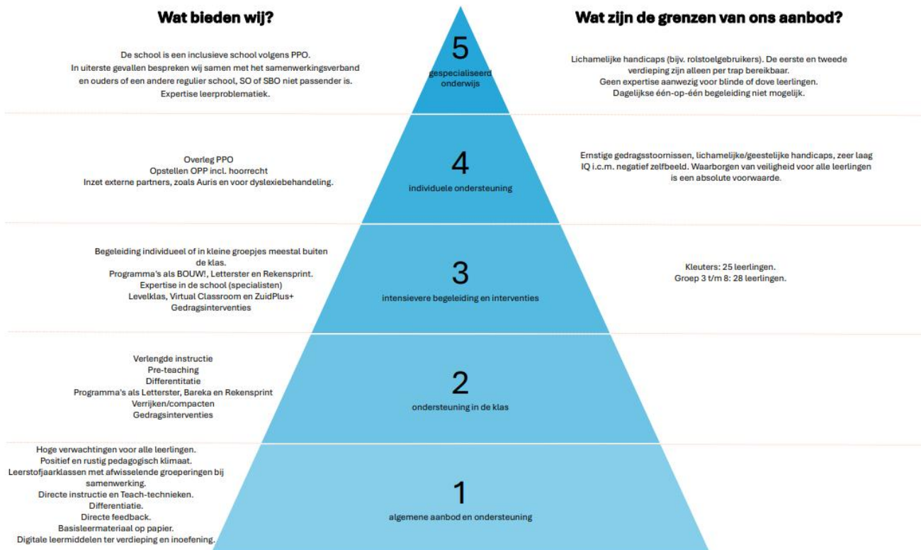
Figuur 1: De ondersteuning van de Oranjeschool.

In figuur 1, de basisondersteuning en extra ondersteuning, is te zien wat de mogelijkheden en onmogelijkheden (grenzen) van de ondersteuning op de Oranjeschool zijn. Binnen PCB Oranjeschool hebben we een aantal extra voorzieningen, met name voor leerlingen die in ondersteuningsniveau 2, 3 of 4 zitten. Per ondersteuningsniveau wordt weergegeven wat de extra ondersteuning (wat bieden wij) inhoudt. In de PBS-piramide (zie figuur 2) is te zien hoe de Oranjeschool het gedrag positief ondersteunt op drie niveaus. Het helpt om preventief te werken aan gedrag.